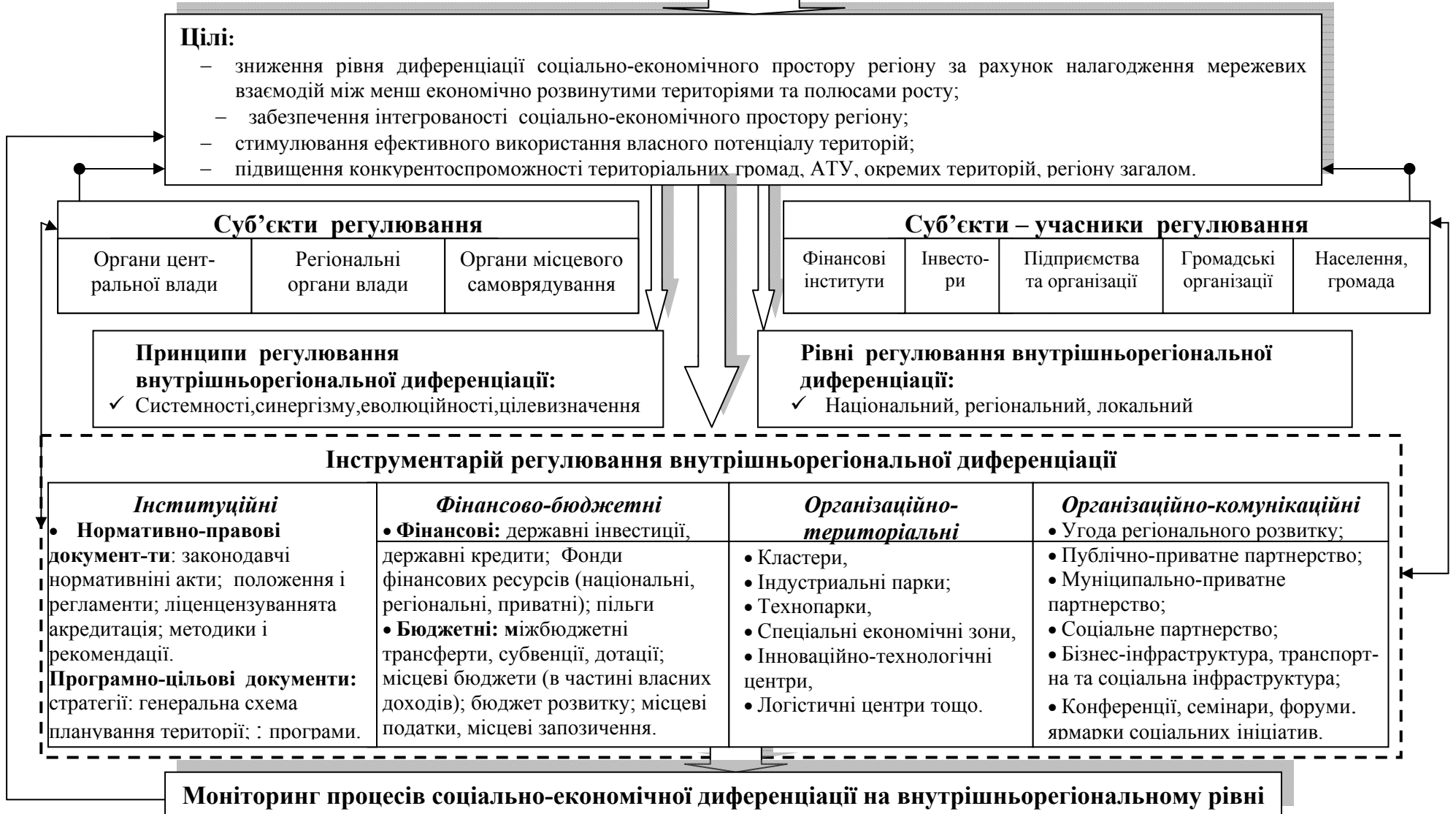
Рис. 2. Концепція регулювання внутрішньорегіональної соціально-економічної диференціації