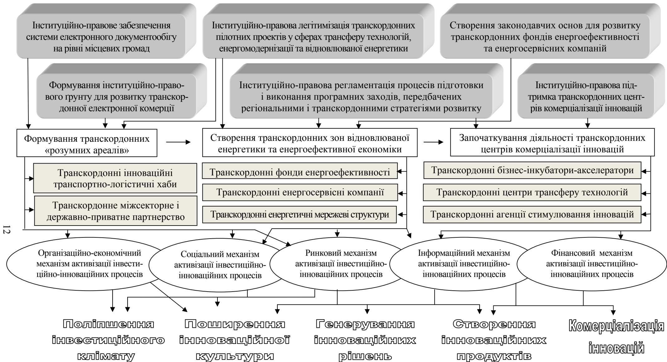
Рис. 3. Напрями трансформації інституційно-правового середовища функціонування механізмів активізації інвестиційно-інноваційних процесів у контексті економічного розвитку українсько-польського транскордонного регіону