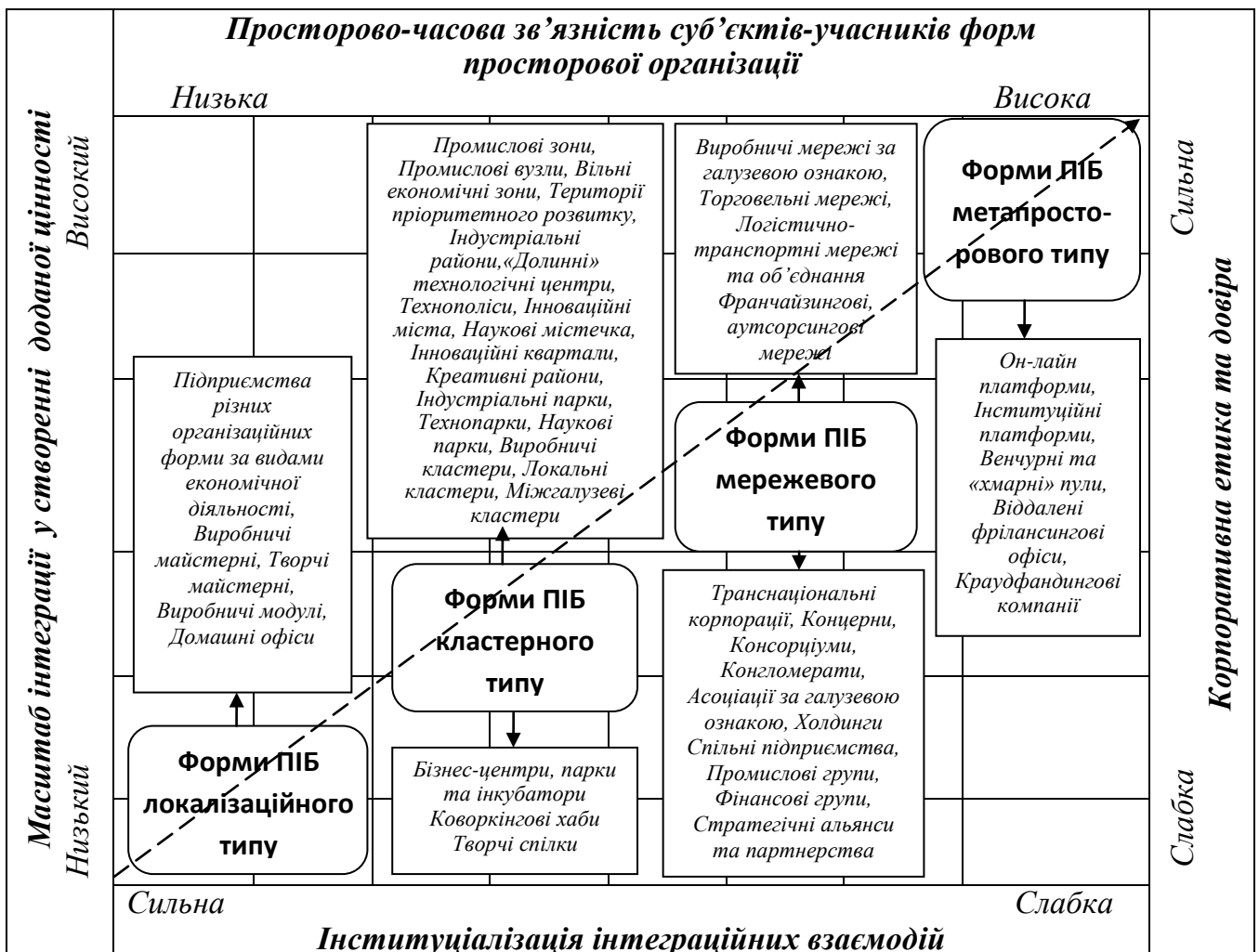
Рис. 1. Матриця форм просторової інтеграції бізнесу

Суб'єктні інтеграційні взаємодії у межах ПІБ реалізуються у відповідних формах ПІБ, розвиток яких рухається по висхідній траєкторії – від кластерних і мережових форм до метапросторових форм інтеграції бізнесу. Висхідна траєкторія розвитку форм ПІБ, представлена на матриці (рис. 1), обґрунтовується тетралатеральним позиціонуванням форм просторової організації бізнесу в системі координат інтеграційних взаємодій. У запропонованому методологічному підході побудови просторової матриці виділено такі координати-визначники: просторово-часова зв'язність і масштаб інтеграції суб'єктів-учасників форм просторової організації у створенні доданої вартості (цінності), статус інституціалізації інтеграційних взаємодій, створення та дотримання норм і постулатів ділової етики та довіри. Зокрема, для метапросторових форм ПІБ характерний високий ступінь просторово-часової зв'язності на основі високого рівня довіри учасників цього інтеграційного утворення та високого масштабу інтеграції учасників у створення доданої вартості (цінності) за доволі слабкої інституціалізації їх взаємодій.