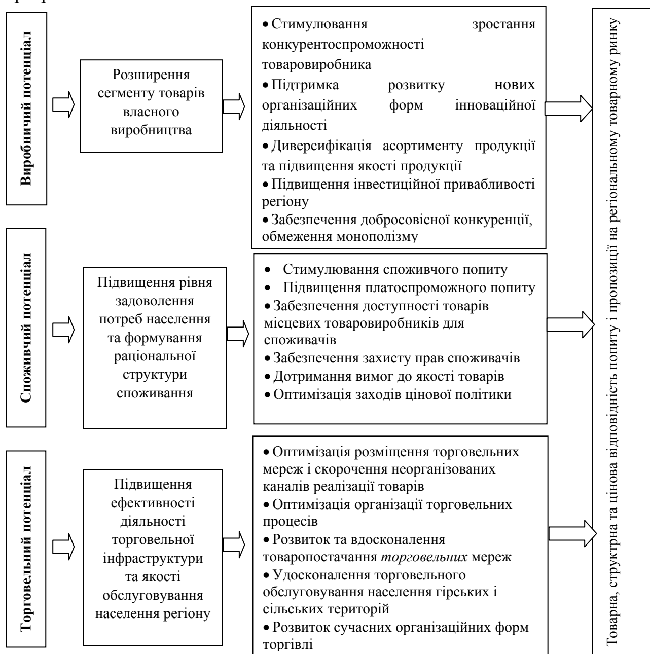
Рис. 4. Стратегічні пріоритети розвитку ринкового потенціалу регіону

Задля посилення соціальної спрямованості стратегування регіонального розвитку запропоновано врахувати індикативні параметри ринкового потенціалу регіону. Аналіз стану та тенденцій економічного розвитку регіонів при розробці регіональної стратегії потрібно доповнити індикаторами частки пропозиції власного виробництва, в тому числі і в розрізі номенклатури продукції, а також рівня доступу до товарних ринків різних типів проблемних територій. Це створить передумови для прогнозування кон'юнктури регіональних ринків з урахуванням впливу змін зовнішнього середовища та обґрунтування стратегічних і оперативних цілей регіональних стратегій і програм.