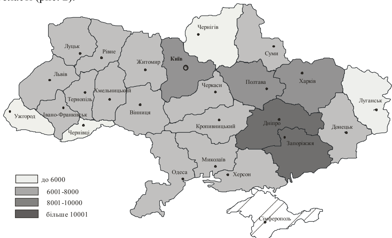
Рис. 2. Індекс ринкового потенціалу регіонів України, 2019 р.

У роботі емпірично доведено, що вищий індекс ринкового потенціалу певного регіону обумовлений вищим ступенем концентрації виробників і споживачів і вищим рівнем економічної активності регіону загалом. Так, до групи регіонів з найвищими значеннями індексу ринкового потенціалу у 2018 р. увійшли Запорізька, Дніпропетровська, Харківська, Полтавська та Київська області (рис. 2).