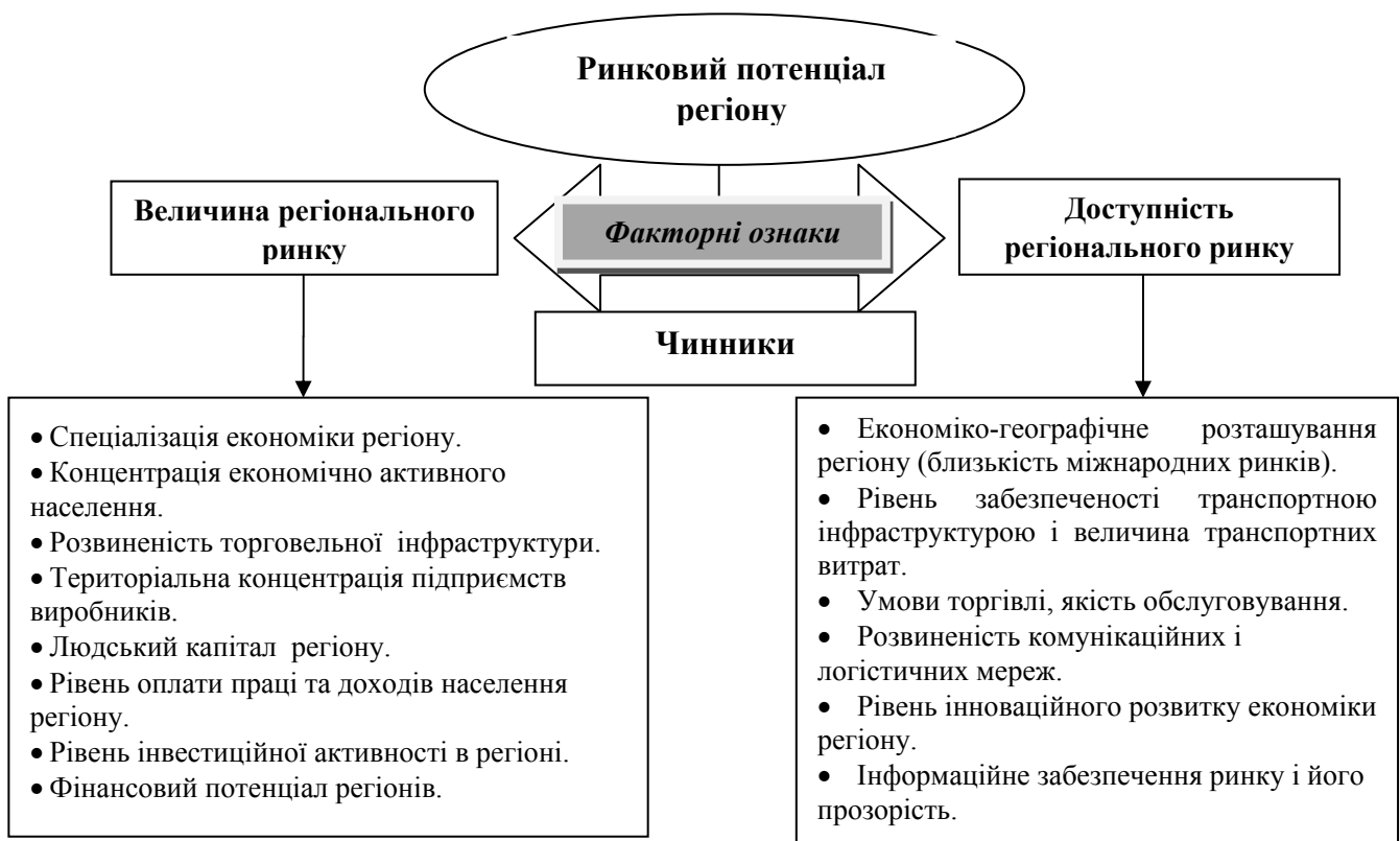
Рис. 1. Факторно-критеріальна модель ринкового потенціалу регіонів

Проведений аналіз гіпотез дозволив визначити чинники впливу на величину ринкового потенціалу та доступність регіональних ринків (рис. 1).