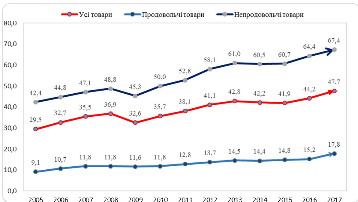
Рис. 3. Частка імпорту у роздрібному товарообороті України, % * Розраховано за даними Державної служби статистики України

Серед регіонів України у 2017 році найвище значення (>50%) частки імпорту у роздрібному товарообороті було у Вінницькій і Одеській областях, а найнижче (<40%) – в Сумській, Чернігівській і Кіровоградській (табл. 5). Упродовж 2012-2017 років найбільше зростання цього показника відбулось у Черкаській (на 14,0 в.п.), Житомирській (на 11,9 в.п.), Миколаївській (на 10,9 в.п.), Вінницькій (на 10,8 в.п.), Тернопільській (на 10,3 в.п.) і Херсонській (на 10,1 в.п). Водночас у Луганській, Донецькій, Івано-Франківській і Закарпатській областях частка імпорту у роздрібному товарообороті зростає менше, аніж на 3 в.п.