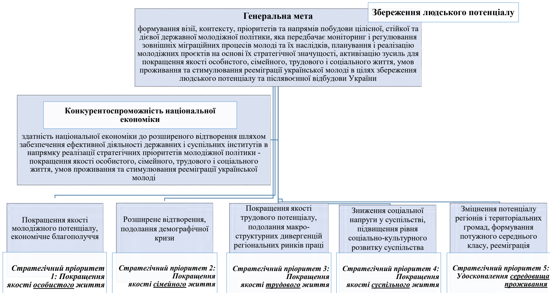
Рис. 1. Генеральна мета та стратегічні пріоритети Дорожньої карти реалізації державної політики збереження людського потенціалу України