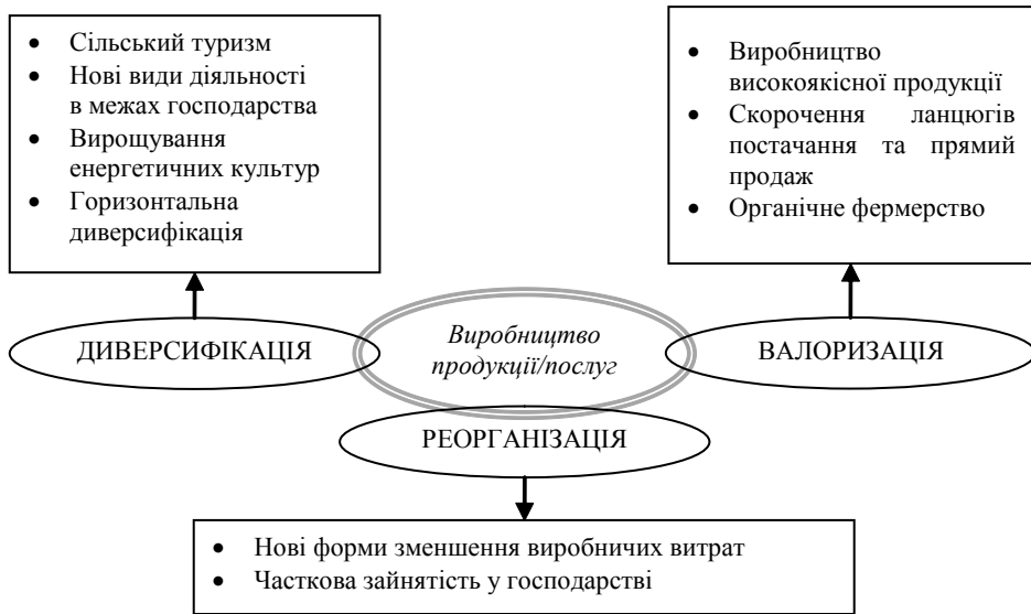
Рис. 2. Модель функціонування європейського фермерського господарства (Побудовано на основі [8])

ки спрямована на підтримку взаємодії на міжнаціональному та трансрегіональному рівнях за рахунок просування об'єднаних зусиль у вирішенні спільних проблем з метою забезпечення гармонійного та збалансованого розвитку ЄС [9, с. 6].