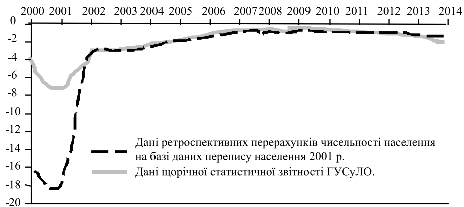
Рис. 3. Прогноз динаміки сальдо міграцій у Львівській області до 2014 р. (Побудовано автором на основі даних щорічної статистичної звітності Головного управління статистики у Львівській області)