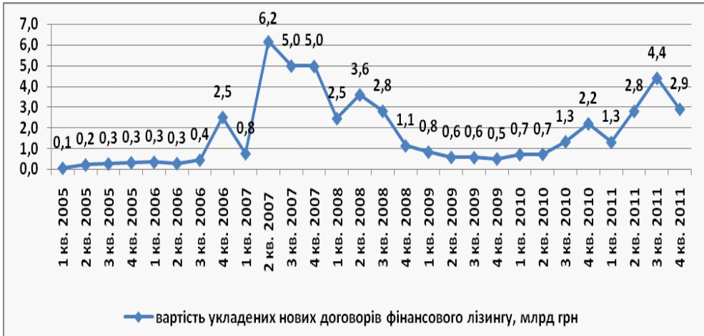
Рис. 2. Динаміка вартості укладених нових договорів фінансового лізингу в Україні протягом 2005-2011 рр., млрд. грн. (Побудовано на основі даних [7; 10])

Середньорічний показник росту лізингового портфеля країни протягом 2003-2008 рр. становив 233,65%, що було рекордним показником не лише для країн СНД, а й для Європи. Однак, починаючи з 2007 р., темпи зростання портфеля та вартості укладених нових лізингових договорів почали повільно спадати (рис. 2).