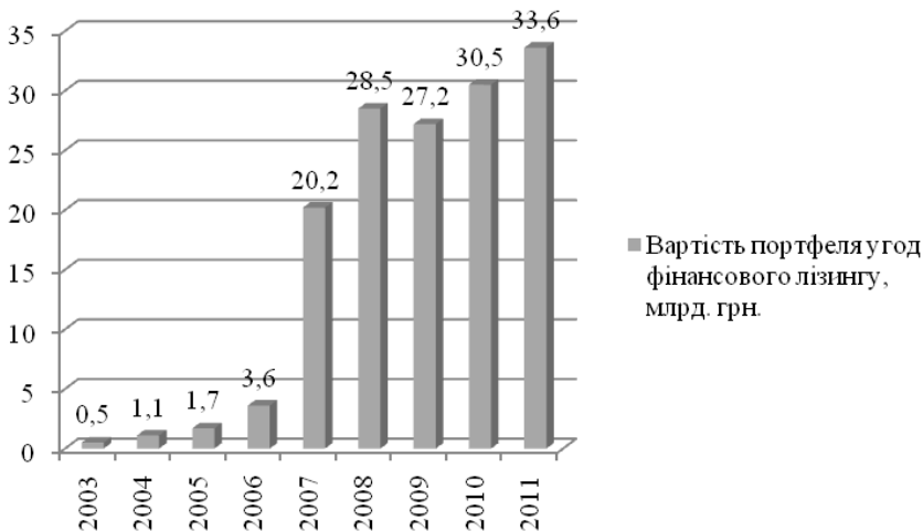
Рис. 1. Динаміка обсягу портфеля договорів фінансового лізингу України протягом 2004-2011 рр., млрд. грн. (Побудовано на основі даних [8-10]).

Стабільна економічна ситуація в країні, сформована нормативно-правова база (яка, незважаючи на наявні недоліки, створює основи для розвитку лізингу в країні і регулює основні відносини між суб'єктами на ринку), прихід іноземних інвесторів, стрімкий розвиток ринку банківських послуг позитивно відобразилися на поширенні та популярності лізингу як інструменту фінансування капіталовкладень вітчизняних суб'єктів господарювання (рис. 1).