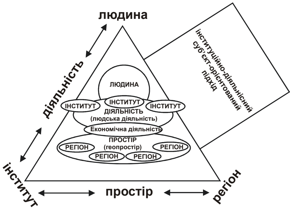
Рис. 2. Базові поняття інституційно-діяльнісного суб'єкт-орієнтованого підходу в регіональних дослідженнях

мічну, інноваційну, соціальну та іншу), людська діяльність структурує простір, творить його структурні «клітини» – регіони, регіони формують середовище людської життєдіяльності, впливають на формування та функціонування людських спільнот. Далі цикл розвитку замикається і повторюється знову.