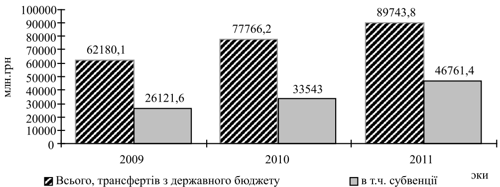
Рис. 2. Надано трансфертів з державного бюджету місцевим бюджетам Побудовано за даними Висновків Рахункової палати щодо виконання Державного бюджету України за 2009, 2010, 2011 рр. - К. 55 с., 63 с., 65 с. (с.48), (с.58), (с.58).

Якщо порівнювати обсяги субвенцій з державного бюджету місцевим бюджетам, виділені у 2012 р. порівняно з 2004 р., то побачимо, що вони