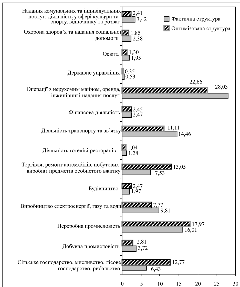
Рис. 1. Структура інвестицій в основний капітал Західного регіону України (за видами економічної діяльності), %

структури капіталовкладень у Західному регіоні за трьома названими критеріями дозволяють констатувати необхідність зростання часток у цій структурі чотирьох ВЕД: переробної промисловості (до 17,97%), торгівлі (до 13,05%), сільського господарства (до 12,77%), будівництва (до 2,47%) при одночасному зменшенні часток решти ВЕД (рис. 1).