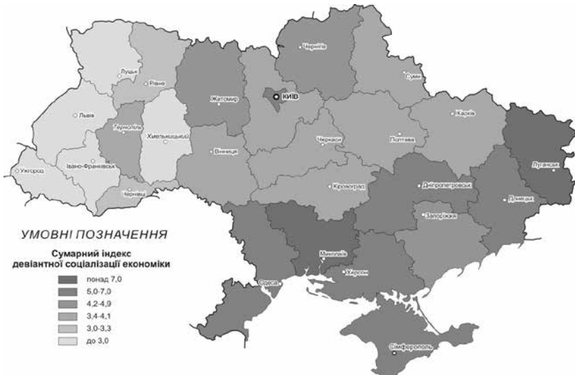
Рис. 1. Регіональні відмінності сумарного індексу девіантної соціалізації економіки

Об'єктивні підтвердження наявні також і для високих значень сумарного індексу у Миколаївській області, яка в останні роки набула