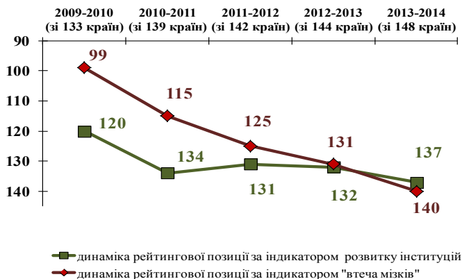
Рис. 2. Динаміка рейтингових позицій за індикаторами розвитку інституцій та «втечі мізків» індексу глобальної конкурентоспроможності України за 2009-2014 рр. (Складено авторами на основі джерела: [30])

Про важливість природної компоненти інтелекту людського капіталу свідчить трансформація окремих показників у звіті з глобальної