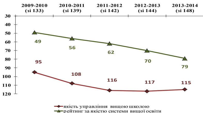
Рис. 3. Динаміка субіндексів якості управління вищою школою та якістю системи вищої школи індексу глобальної конкурентоспроможності України за 2009-2014 (Складено авторами на основі джерела: [30])

Як бачимо, за останні 5 років рейтинг України за показниками розвитку вищої освіти різко знизився: на 30 позицій – з 49 позиції у рейтингу 2009-2010 рр. до 79 позиції – у рейтингу 2013-2014 рр., що свідчить про катастрофічне зниження конкурентоспроможності однією із найбільш конкурентних галузей вітчизняної економіки. Істотно повпливали на таке зниження як погіршення якості управління цією сферою (зниження позиції України у рейтингу з 95 місця до 115 за аналогічний період), так і «втеча