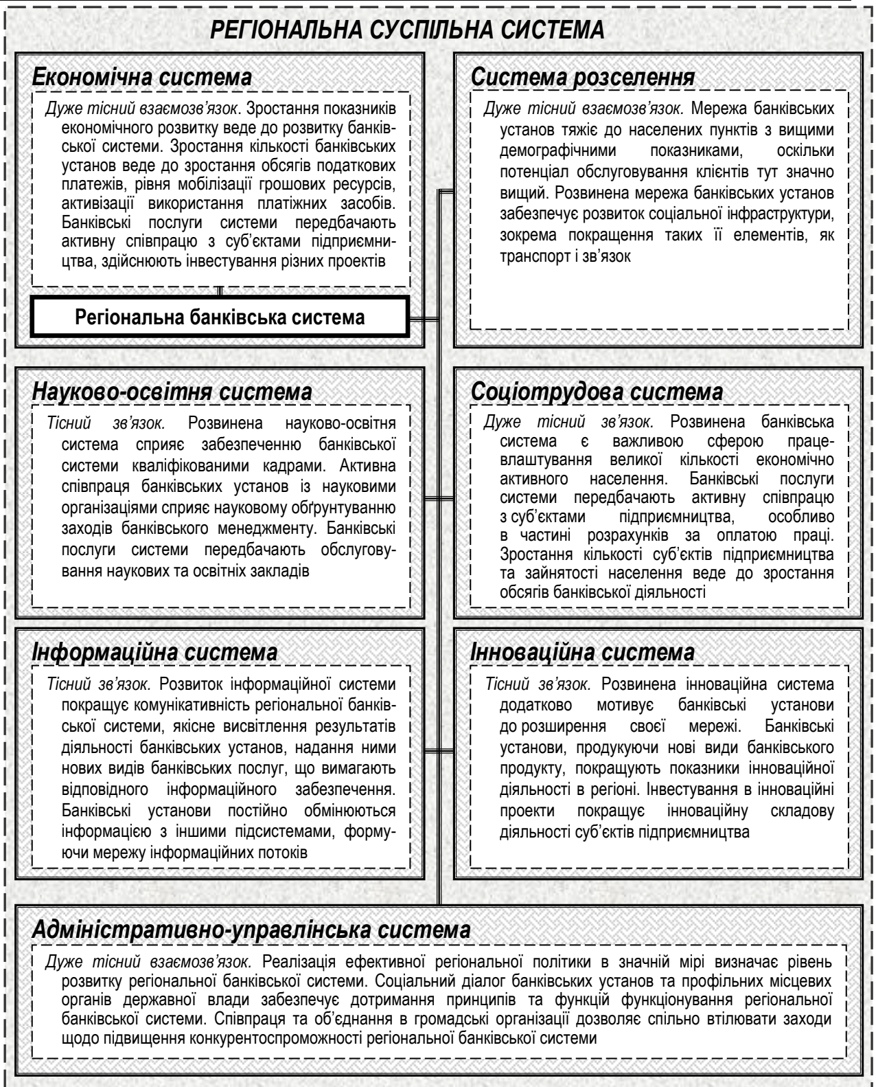
Рис. 2. Основні взаємозв'язки регіональної банківських системи з іншими підсистемами регіону*