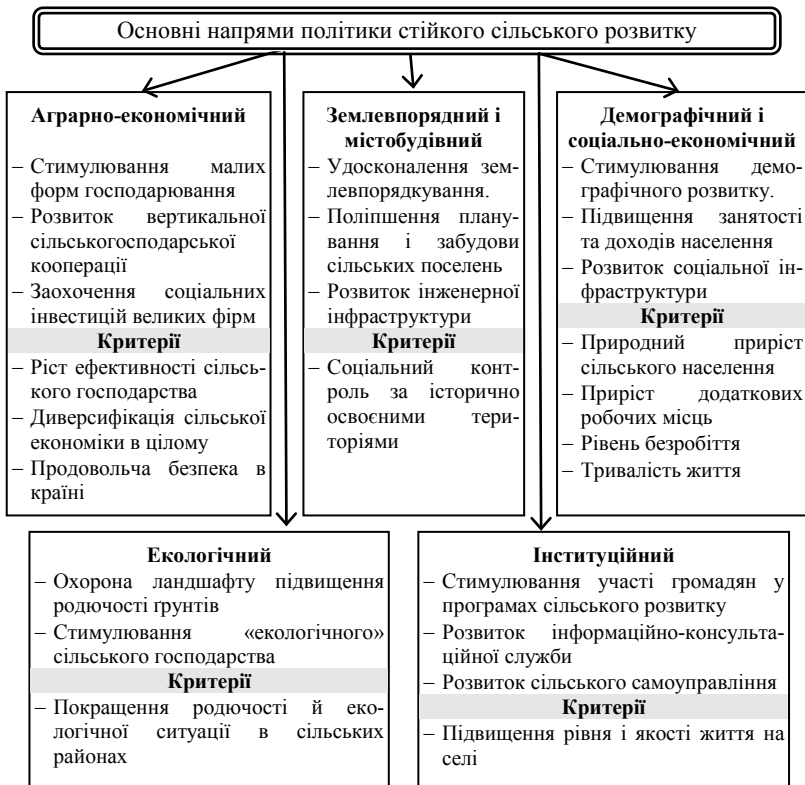
Рис. 1. Напрями політики стійкого розвитку сільських територій (Складено за: [2])

аграрно-промислового комплексу (АПК). В більшості розвинених країн, зокрема США, Канаді та країнах Західної Європи, з державного бюджету підтримуються тільки фермери і створені ними кооперативи [4]. Існують також обмеження за розмірами допомоги із розрахунку на один суб'єкт господарювання («в одні руки»). В Україні, внаслідок недосконалості інституцій, більша частина бюджетної підтримки припадає на великі підприємства, найчастіше приватні.