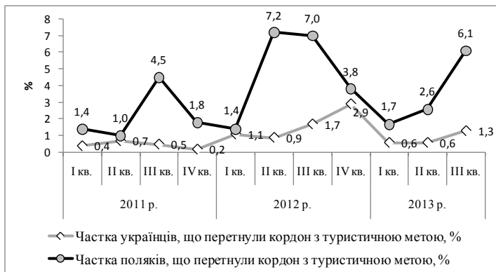
Рис. 2. Частка українців та поляків, що перетнули українсько-польський кордон з туристичною метою, 2011-2013 рр. (Побудовано за: [1])

народної творчості на Національному Сорочинському Ярмарку – у с. Великі Сорочинці Миргородського району Полтавської області та інші.