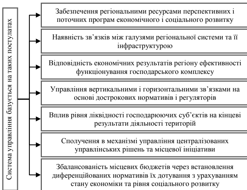
Рис. 2. Постулати, на яких базується система управління регіональним розвитком

У систему аналізу потрібно закласти ті пріоритети, на які регіональні органи влади мають реальний вплив і на реалізацію яких мають відповідні ресурси. В основі нових підходів до аналізу стану регіонального розвитку та ефективності управлінських рішень мають бути: