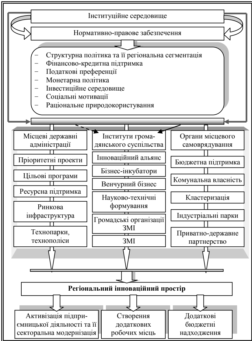
Рис. 3. Модель управління інноваційним розвитком бізнес-середовища