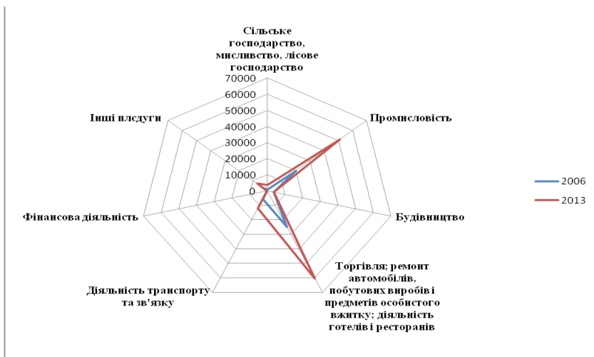
Рис. 1. Динаміка структурних змін за секторами економіки в абсолютних показниках у 2006-2013 рр.

сфер економічної діяльності, щодо реалізації продукції є менше 1%. Така тенденція є свідчення низького рівня диверсифікації економічного потенціалу області.