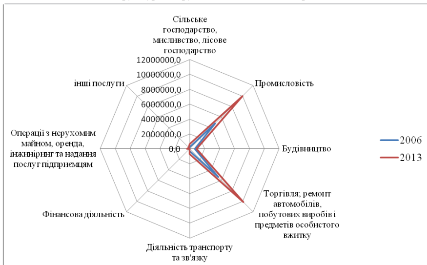
Рис. 1. Динаміка структурних змін за секторами економіки в абсолютних показниках за 2006 та 2013 рр. (млн грн)