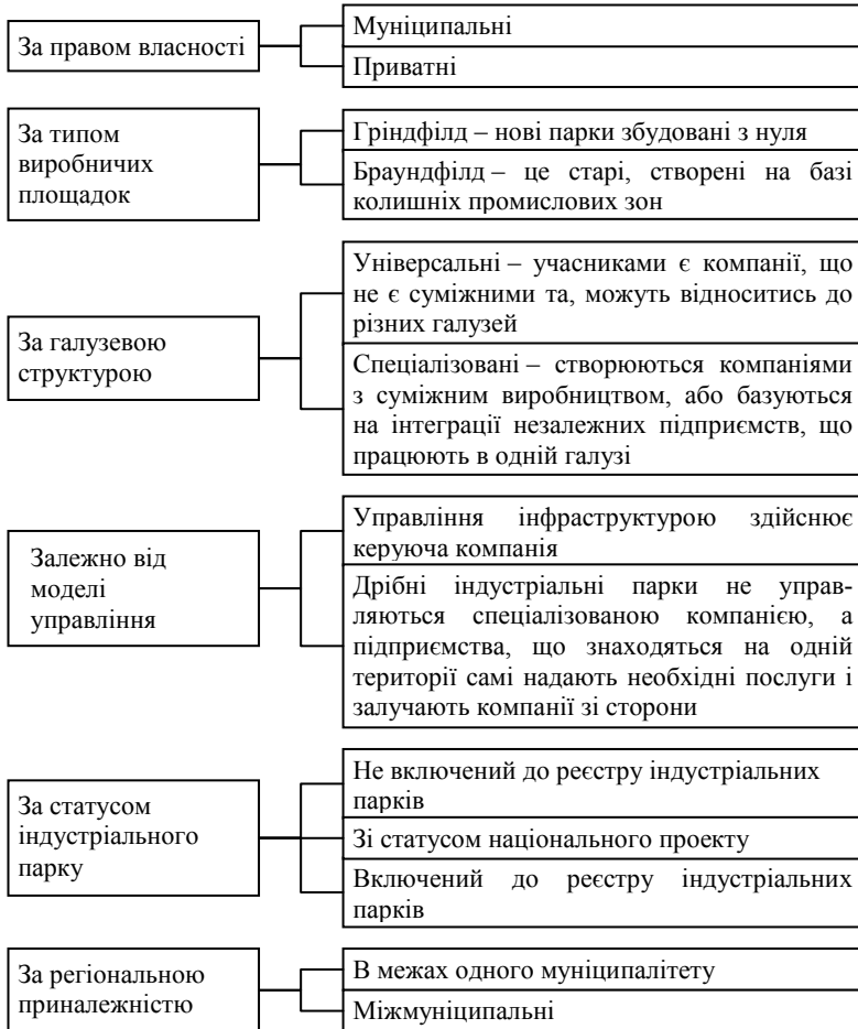
Рис. 2. Класифікація основних видів індустріальних парків

За галузевою структурою ІП розділяють на універсальні та спеціалізовані. Серед резидентів універсальних парків підприємства різних компаній, що не пов'язані між собою технологічними процесами. Єдиним критерієм є те, що підприємства не повинні вступати в протиріччя в плані екології. Спеціалізовані парки, в свою чергу, бувають двох видів. Згідно першого виду – один якірний резидент підбирає під себе компанії