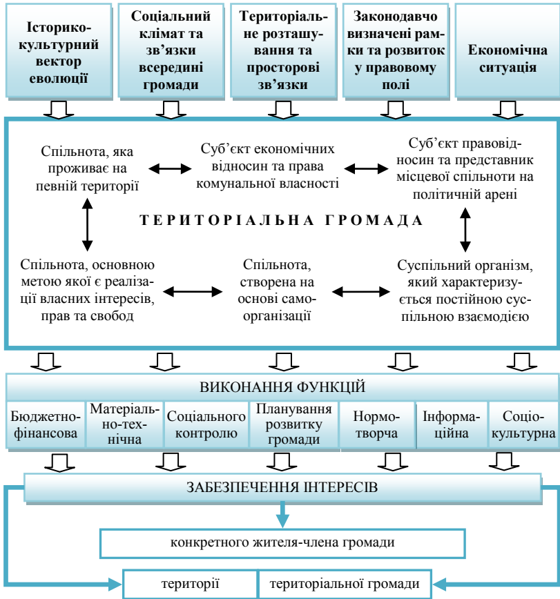
Рис. 2. Схема функціонування територіальної громади як суб'єкта-об'єкта місцевого самоврядування