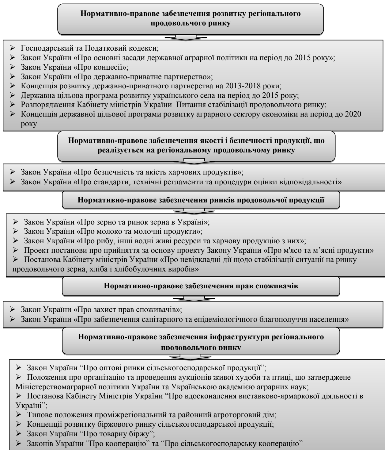
Рис.2. Нормативно-правове забезпечення розвитку регіонального продовольчого ринку*