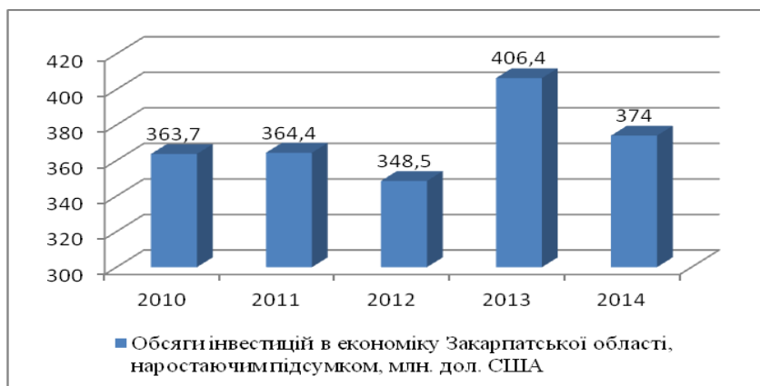
Рис. 2. Комплекс факторів ефективності інвестиційного процесу в Закарпатській області

Розглядаючи фактори ефективності інвестиційного процесу Закарпатської області, вважаємо доцільним поділити фактори на обов'язкові та додаткові. Загалом єдиний комплекс факторів ефективності, що формують інвестиційний клімат в регіоні можна представити наступним чином (рис. 2).