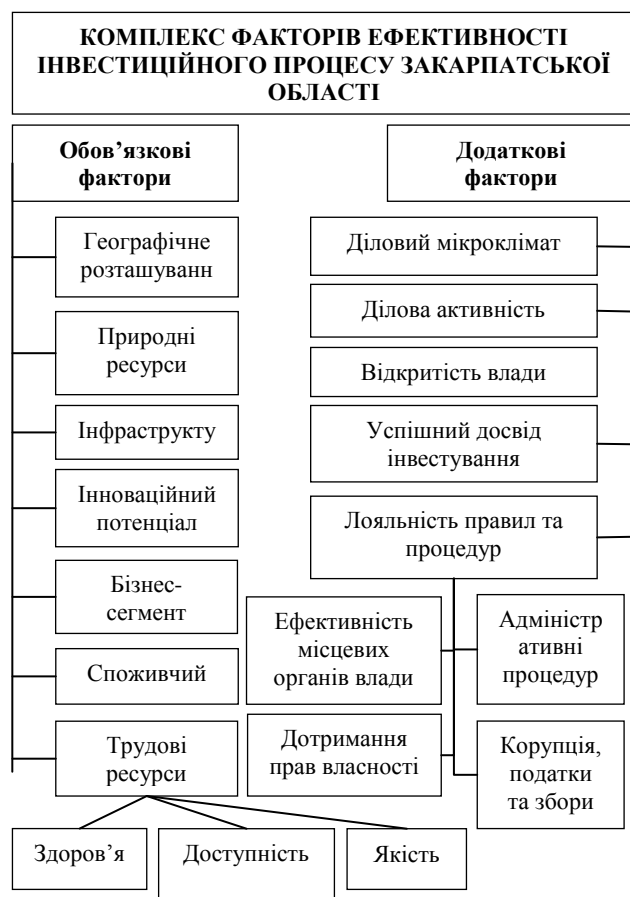
Рис. 3. Прямі іноземні інвестиції (акціонерний капітал) області 2010 – 2014 рр. [10]