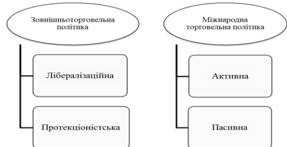
Рис. 1. Види зовнішніх торговельних відносин (розроблено автором)

Вирізняють два основних види зовнішньоторговельної політики: вільну торгівлю (лібералізаційна, фритредерство) та протекціонізм (рис.1.).