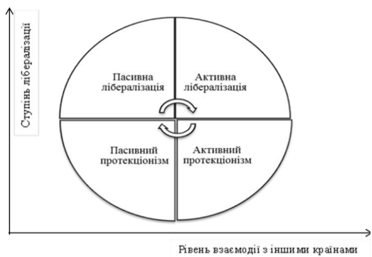
Рис. 2. Моделі регулювання експорту (розроблено автором)

Регулювання експорту на національному рівні відбувається у межах методів, форм та інструментів торговельної політики. Відповідно до таких її ознак, як рівень та кількість обмежень і характер взаємодії з іншими торговельними політиками ідентифіковано такі національні моделі регулювання експорту [5]: активно-лібералізаційна (АЛ), активно-протекціоністська (АП), пасивно-лібералізаційна (ПЛ) і пасивно-протекціоністська (ПП) (рис.2).