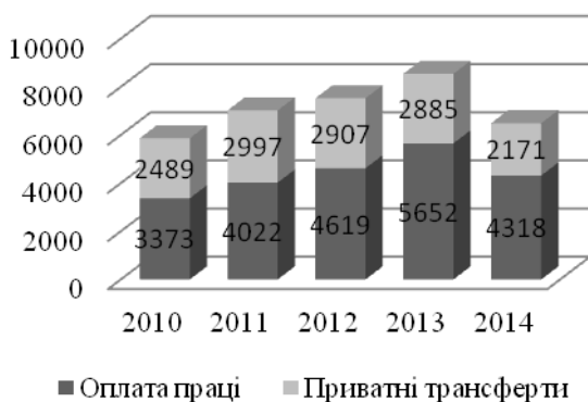
Рис. 1. Структура грошових переказів в Україну за джерелами формування (млн. дол. США)

У 2014 році обсяги грошових переказів в Україну зменшилися на 24% у порівнянні з попереднім роком та становили 6,5 млрд. дол. США. З них 4.3 млрд. дол. США надійшли як «оплата праці», тоді як перекази у формі «приватних трансфертів» становили лише 2.2 млрд. дол. (див. рис. 1) [8, с. 2].