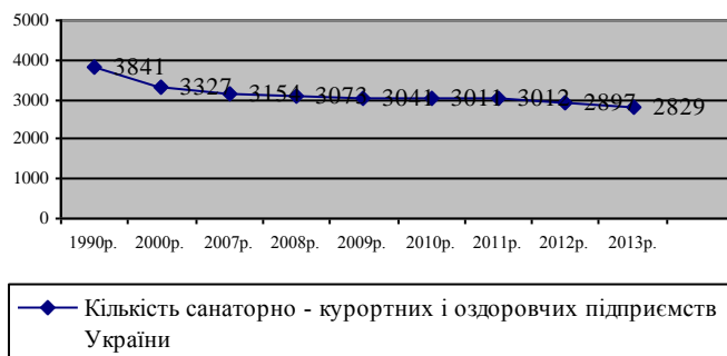
Рис. 1. Динаміка зміни санаторно-курортних і оздоровчих закладів України за 1990-2013рр.[ 2, с.455].

Найбільш гострою проблемою для лікувально – оздоровчого комплексу України виступає форма власності, адже за часів незалежності України певний відсоток підприємств залишається у державній власності, а рівень державного фінансування бажає залишати кращого. Тому в Україні за досліджуваний період 1995 – 2014 роки кількість підприємств лікувально – оздоровчого комплексу зменшилась з 3841 одиниці у 1990 році до 2829 одиниці у 2013 році (рис.1)