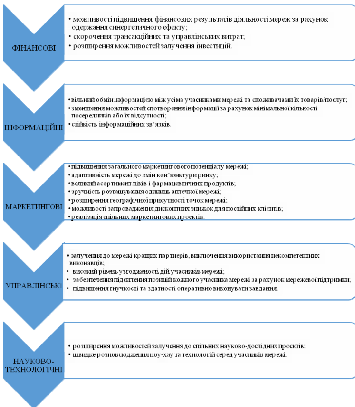
Рис. 1. Конкурентні переваги мережевих бізнес-структур