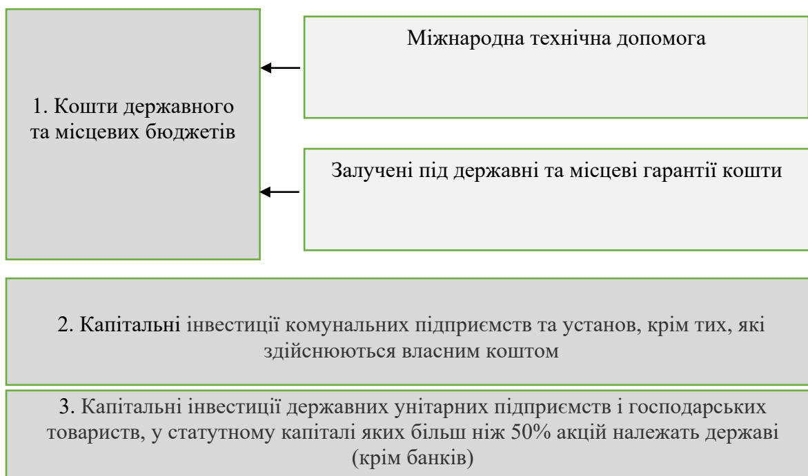
Рис. 1. Джерела публічних інвестицій