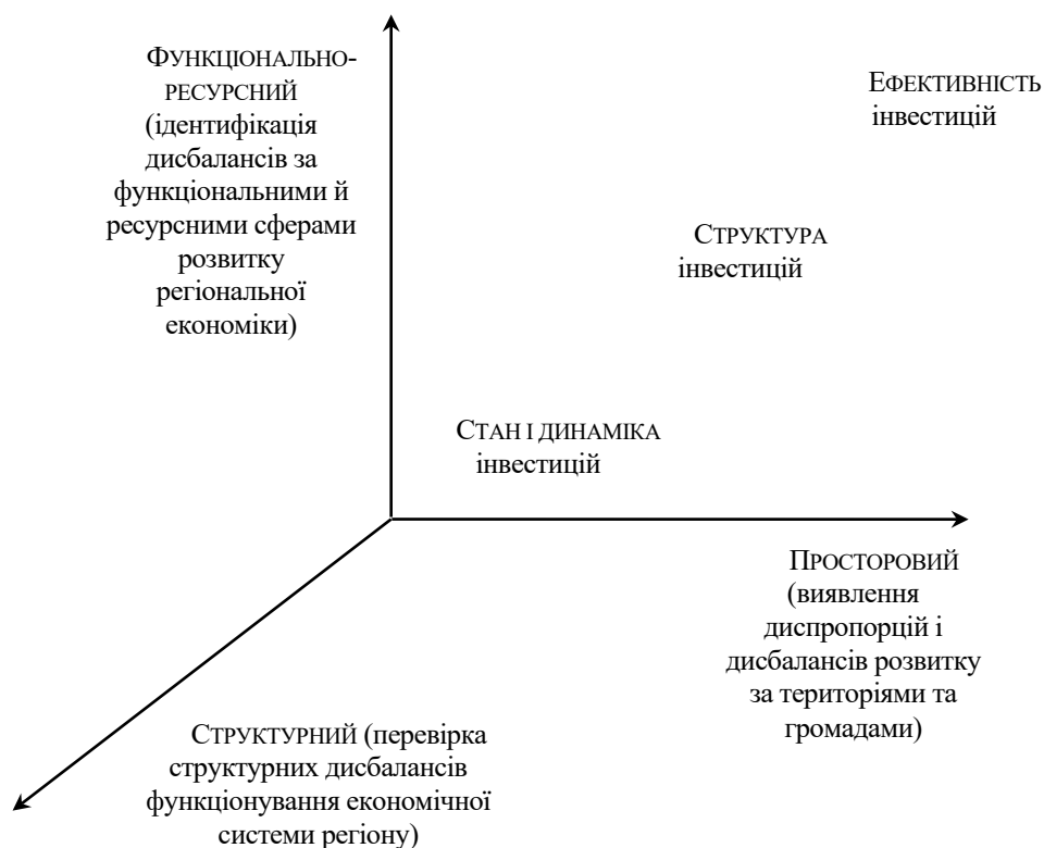
Рис. 2. Методологічний базис формування індикаторів аналізування збалансованого регіонального розвитку та його публічно-інвестиційного забезпечення

Концепційно комплексний розвиток регіону слід розглядати як тривимірну площину, вектори якої формують: I) функціонально-ресурсні сфери; II) просторовий поступ; III) структурні баланси в соціально-економічній системі регіону (рис. 2).