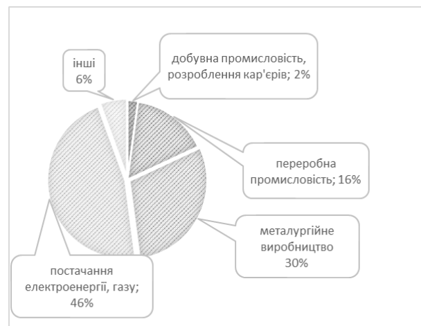
Рис. 1. Викиди діоксиду вуглецю від стаціонарних джерел в Україні (2021 р.), млн т

В Україні до повномасштабного вторгнення спостерігалася тенденція поступового зниження рівня викидів CO 2 від стаціонарних джерел. Наприклад, за період з 2016 р. по 2021 р. обсяг викидів скоротився від 150 до 111 млн т [3]. У 2021 р. найбільша кількість викидів припадає на галузь постачання електроенергії та газу (51,9 млн т [3]), металургійне виробництво (33,3 млн т), переробну промисловість (без металургії) – 17,8 млн т, добувну промисловість і розроблення кар'єрів – 2,5 млн т. Решта стаціонарних джерел сформували 6% загального обсягу викидів, водночас внесок кожного окремого джерела не перевищував 2% (рис. 1).