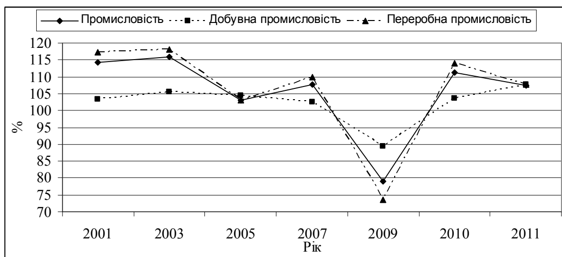
Рис. 1. Індекси промислової продукції (до попереднього року)

Починаючи з 2001 р. у промисловому виробництві України відбувається коливання, пов'язане з різними економічними процесами, що впливають на розвиток національної економіки. Значне падіння промислового виробництва проявляється у 2009 р. в самий пік впливу світової фінансово-економічної кризи, падіння становить 21,9%. Проте вже в 2010 р. приріст промислового виробництва становить 11,2%. Продовжується післякризове зростання і у 2011 р., проте темпи його приросту уповільнились до 7,3%, спричинені внутрішньою політикою держави (рис. 1) [5, с. 3; 6, с. 42].