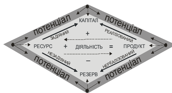
Рис. 4. Результуюча графічна модель базових складових понятійно-термінологічної системи «ресурс-потенціал»

Наведемо одне з визначень потенціалу. Потенціал – наявні в економічного суб'єкта ресурси, їх оптимальна структура та вміння раціонально використовувати їх для досягнення поставленої мети [9, с.387]. Виходячи з цього визначення можемо побачити, що ресурсом економічної діяльності, мабуть, можна вважати і капітал, і продукт (принаймні проміжний продукт) і резерв, які задіюються на різних етапах господарювання. З огляду на це результуючу модель можна зобразити у такому вигляді (рис. 4).