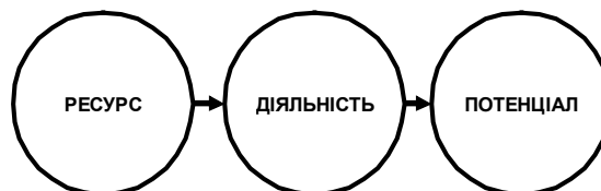
Рис. 1. Співвіднесення понять ресурс, діяльність, потенціал

Вихідною моделлю для формування означеної в назві понятійно-термінологічної системи буде праксеологічний ланцюг: ресурс-діяльність-потенціал (рис. 1).