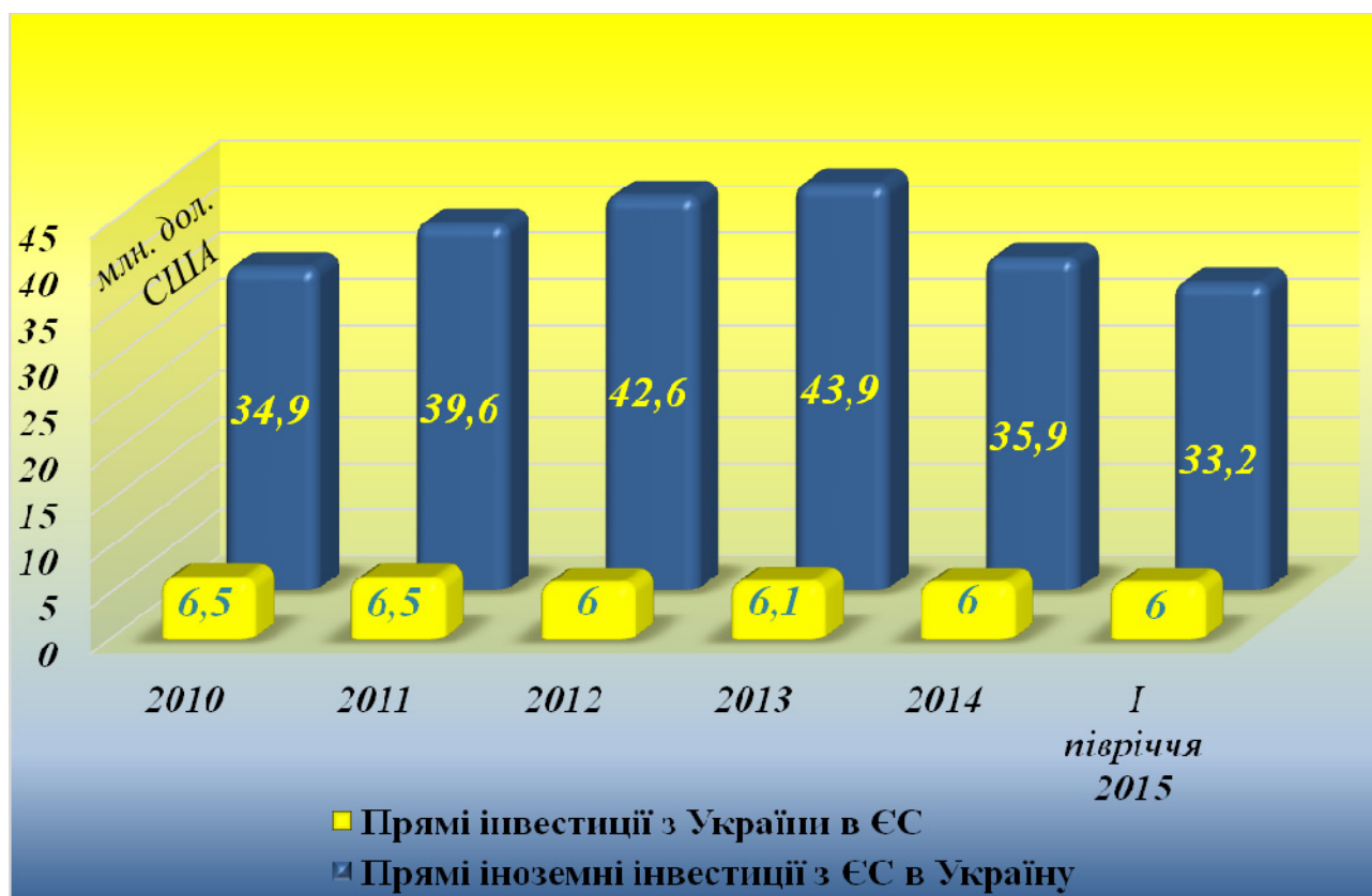
Рис. 2. Динаміка значень прямих інвестицій між Україною і ЄС

на зовнішніх ринках. Серед країн ЄС офшорною зоною є Кіпр. Так, на цю країну відводилося 30% прямих іноземних інвестицій в Україну у 2014 році і 28,6% у січні-вересні 2015 року та 91,6% прямих інвестицій з України у 2014 році і 93,0% у січні-вересні 2015 року. Фактично, в Україні здебільшого відбувався приріст не реальних прямих іноземних інвестицій, а приріст обсягів репатріації капіталу, тобто капіталу, який був свого часу виведений з економіки України. Це ставить під сумнів ефективність використання таких прямих іноземних інвестицій.