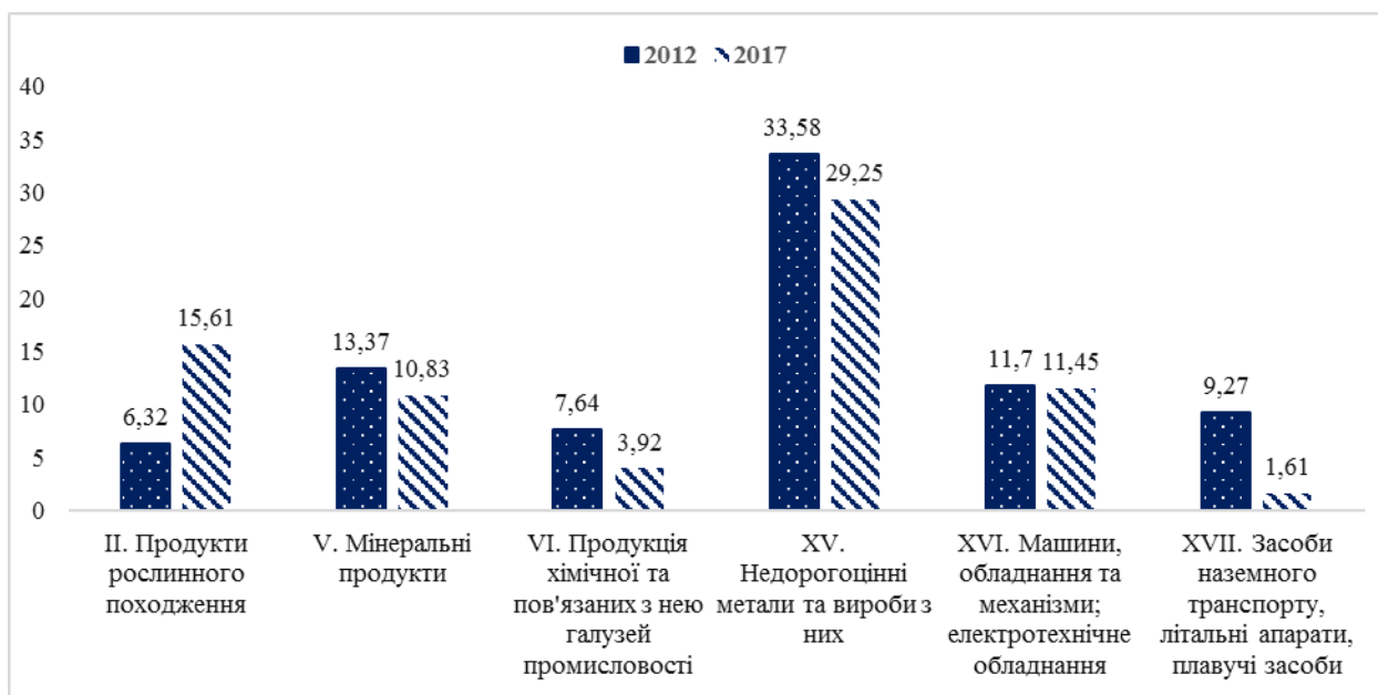
Рис. 2. Структура товарного експорту України (за основними товарними групами), %

Продукція металургійних виробництв (XV товарна група) незмінно домінує в експорті Донецької (80,25% у 2017 році проти 62,78% у 2012-му), Запорізької (56,46% проти 46,2%) і Дніпропетровської (55,19% проти 52,24%) областей. Водночас продукція добувної промисловості (V товарна група) стала основою товарного експорту Полтавської області із часткою 51,99% у 2017 році (проти 34,91%). У 2012 році профільною експортною продукцією в цьому регіоні були транспортні засоби (XVII товарна група), однак у 2017-му їх частка скоротилась на 41,77 в.п. (до 1,44%) 1 , а в структурі товарного експорту України – на 7,66 в.п. (до 1,61%).