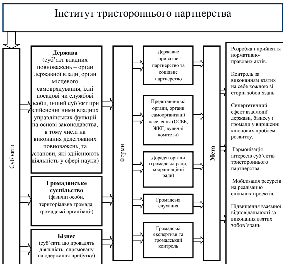
Рис. 1. Суб'єкти, форми та мета тристороннього партнерства

Тому партнерські відносини держави – бізнесу - «третього сектора» повинні будуватись на нормативно-правовій базі, яка б врегулювала прозорі відносини стосовно: права власності; судової системи; податкової системи та адміністрування податків; діяльності господарюючих суб'єктів монополістів та природних монополістів зокрема; бережливого використання надр; наповнення бюджетів усіх рівнів (сімейних, місцевих та державного). Результатом має стати громадянське суспільство, в якому норми, записані в нормативно-правових актах, будуть безумовно виконуватись та дотримуватись усіма суб'єктами тристоронніх