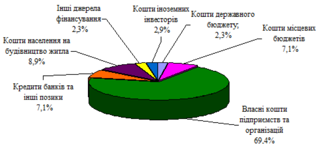
Рис. 3. Розподіл капітальних інвестицій за джерелами фінансування, у відсотках за 2015 р. [6]

Сьогодні, якщо розглядати інвестиції в основний капітал в Україні (за джерелами фінансування), можна побачити такі тенденції: основними джерелами як були, так і є власні кошти (69,4% загального обсягу), стрімкий спад банківського кредитування (з 22,1% у 2012 році до 7,1% у 2015 році), скорочення інвестування в основний капітал іноземними інвесторами (з 4,2% у 2013 році до 2,9 у 2015 році). За рахунок державного та місцевих бюджетів освоєно 9,4 відсотка капітальних інвестицій. Частка коштів населення на будівництво житла близько 8,9%, інші джерела фінансування – 2,3% [6].